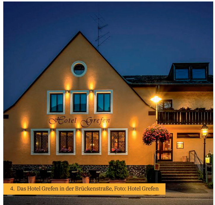
4. Das Hotel Grefen in der Brückenstraße