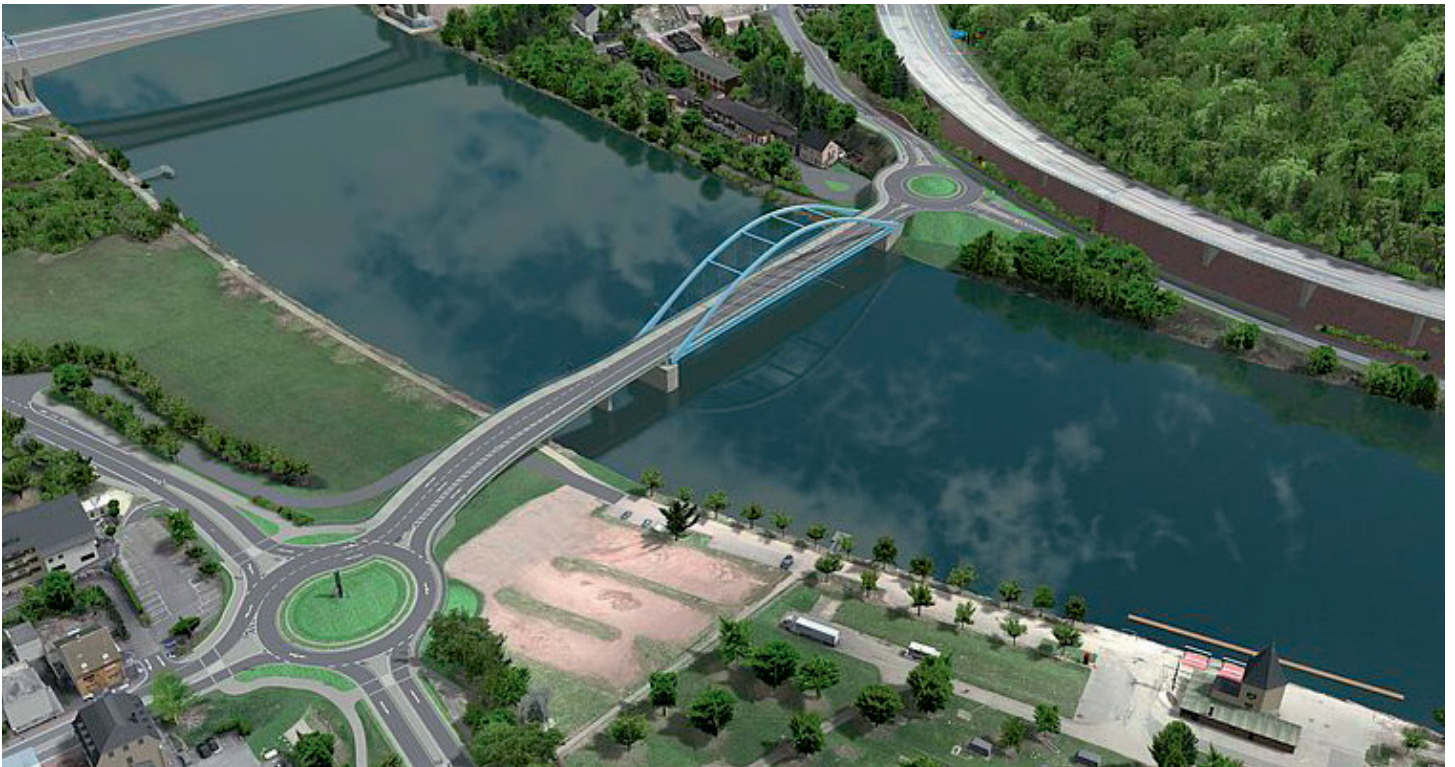
7. So soll die neue Schweicher Moselbrücke aussehen, Visualisierung: Landesbetrieb Mobilität Trier www.lbm.rlp.de

Leider hat die Planung des LBM ein entscheidendes Manko. Obwohl es Ziel der Landespolitik ist, den Fahrradverkehr deutlich zu stärken, plant der LBM lediglich auf der unterstromigen Gehwegseite einen kombinierten Fuß-/Radweg; auf der oberstromigen Seite ist lediglich ein Fußweg vorgesehen. Aus diesem Grund hat der Stadtrat in seiner Sitzung am 16.10.2024 mehrheitlich beschlossen, gegen den Planfeststellungsbescheid Klage zu erheben, da sich die Stadt deutlich in ihren berechtigten Interessen beeinträchtigt sieht.