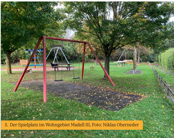
5. Der Spielplatz im Wohngebiet Madell III, Foto: Niklas Oberneder