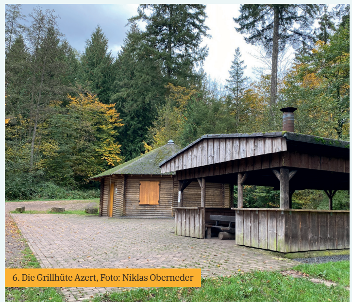
6. Die Grillhütte Azert

Die Hütte bietet Einrichtungen wie einen Grill, einen Barbereich, fließendes Wasser und Stromversorgung. Die Hütte bietet ausreichend Platz im Innenbereich und verfügt über zusätzliche Sitzgelegenheiten im Freien sowie eine Sanitäreanlage. Für Besucher, die mit dem Auto anreisen, stehen auch Parkplätze zur Verfügung. Anmietungen sind über das Stadtbüro Telefon: 06502/9338-26 oder per eMail unter info@stadt-schweich.de möglich.