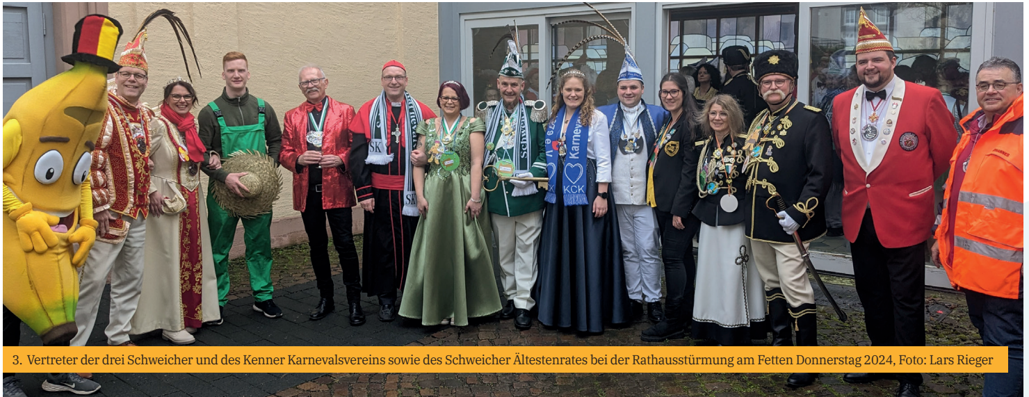
3. Vertreter der drei Schweicher und des Kenner Karnevalsvereins sowie des Schweicher Ältestenrates bei der Rathausstürmung am Fetten Donnerstag 2024

Mit dem Isseler Cultur Verein, der Narrengilde Stadthusaren Schweich und dem Schweicher Karnevalverein verfügt unsere Stadt über gleich drei sehr aktive Akteure insbesondere in der närrischen Zeit, aber auch darüber hinaus. So haben bspw. alle drei Vereine Stände am Heimat-, Wein- und Erntedankfest 2023 und 2024 betrieben. Ohne die vielen Vereine wäre dieses Fest nicht zu stemmen. Ein Grund, warum wir die Ehrenamtlichen in „Zur Sache Schweich“ in den Fokus rücken möchten.